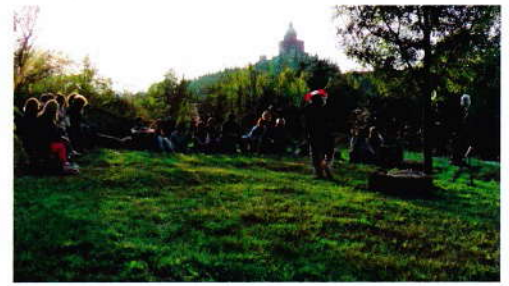
Parco San Pellegrino