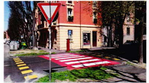
Zona 30 Turati